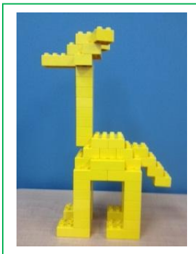
基本ブロックで作ったキリンです。